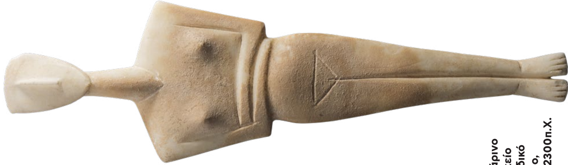
Μαρμάρινο γυναικείο κυκλαδικό ειδώλιο, 2800-2300π.Χ.